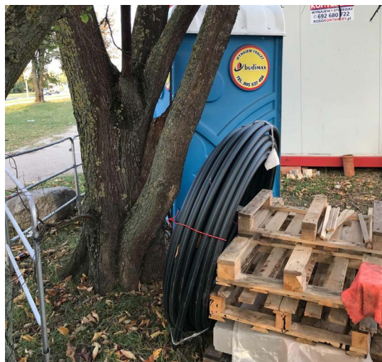
Składowanie materiałów budowlanych i śmieci ul. Wojska Polskiego i ul. Solskiego -2021r